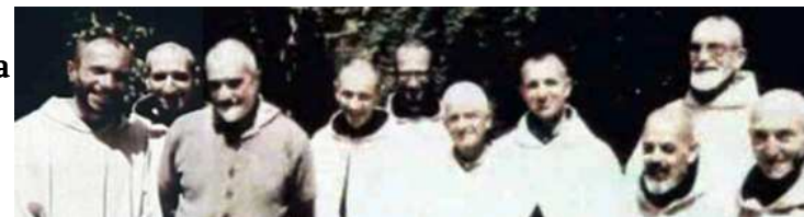
Monaci Trappisti di Tibhirine uccisi in Algeria nel 1996