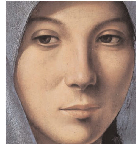
Antonello da Messina: la Madonna Annunziata, ca.1476, Museo Nazionale di Palermo

Si aprì il tempio di Dio che è nel cielo e apparve nel tempio l'arca della sua alleanza. Un segno grandioso apparve nel cielo: una donna vestita di sole, con la luna sotto i suoi piedi e, sul capo, una corona di dodici stelle. Era incinta, e gridava per le doglie e il travaglio del parto. Allora apparve un altro segno nel cielo: un enorme drago rosso, con sette teste e dieci corna e sulle teste sette diademi; la sua coda trascinava un terzo delle stelle del cielo e le precipitava sulla terra. Il drago si pose davanti alla donna, che stava per partorire, in modo da divorare il bambino appena lo avesse partorito. Essa partorì un figlio maschio, destinato a governare tutte le nazioni con scettro di ferro, e suo figlio fu rapito verso Dio e verso il suo trono. La donna invece fuggì nel deserto, dove Dio le aveva preparato un rifugio. Allora udì una voce potente nel cielo che diceva: «Ora si è compiuta la salvezza, la forza e il regno del nostro Dio e la potenza del suo Cristo». Ap 11,19; 12,1-6.10