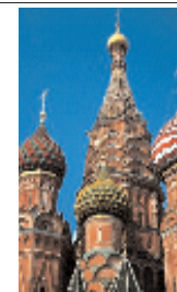
Mosca - San Basilio