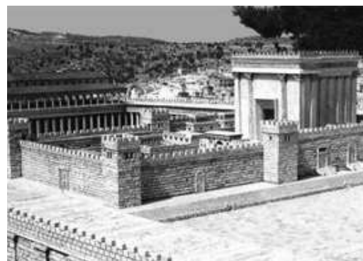
Plastico del Tempio di Gerusalemme